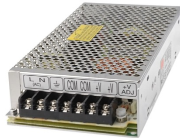
(2) FUENTE DE 12 VCC

LAS DOS OPCIONES SON DE 100 A 220 Vca CON CONEXIÓN DE CLAVIJA AMERICANA Y EUROPEA