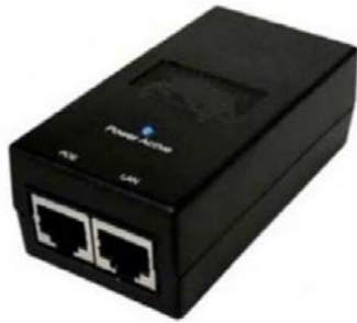
(1) ALIMENTADOR POE